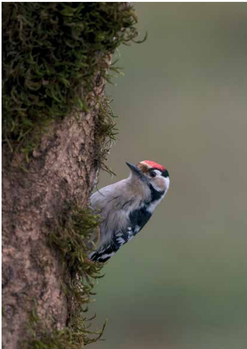
Abb. 28: Kleinspecht, Lesser Spotted Woodpecker, Dingener Heide WES, 23.03.2009.

Keine Brut/kein Brutverdacht im Kreis Herford HF