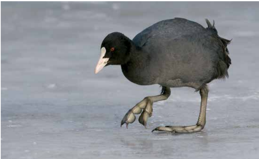
Abb. 19: „Spikes“ und breite Füße helfen bei Glatteis: Blässhuhn im Februar 2009 auf dem vereisten Aasee in Münster. Eurasian Coot on ice, Aasee in Münster.

Mind 3 besetzte Reviere NSG Recker Moor, Recke ST (BSt ST) < 24.3. eine im NSG Lanstroper See DO, dort auch eine am 2.4. (kük) < 12.4. eine rufend Klärteich Arnsberg-Wildshausen HSK (wiw, hek) < 18.4. eine im LSG Lippewiesen (pow) < 2.5. 6 Rufer max Rieselfelder Münster MS (eff, lah) < 2.-5.5. eine NSG Engerbruch HF – erster Nachweis seit 1998 im Kreis Herford (möe, mep, coc, nip) < 2.5. eine rufend Griethauser Altrhein, Rees KLE (dod, bif, ban u.a.) < 19.5. ein Rufer im NSG Ahsewiesen SO (frw) < Anfang Juli Totfund eines Jungvogels Unteres Eggeltal HX (löm, bei) < 11.8. eine Bedburger Klärteiche, Bedburg BM (seg, klh, huk), dort auch eine am 30.8. (eup) < 18.8. 2 Bedburger Klärteiche, Bedburg BM (wyk) < 30.8. eine alter Klärteich bei Tönisheide, Velbert ME (böck) < 30.8. eine an den Scheringteichen im Radbodseege-