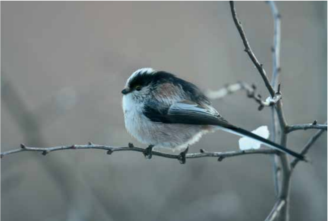
Abb. 30: Bei Kälte schützt die Kugelform: Schwanzmeise, Long-tailed Tit , in Kranenburg KLE, 06.01.2009.