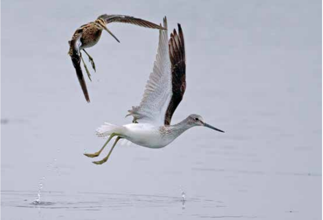
Abb. 25: Grünschenkel, Common Greenshank , mit Bekassine, Common Snipe , Rieselfelder Münster, Aug 2009.