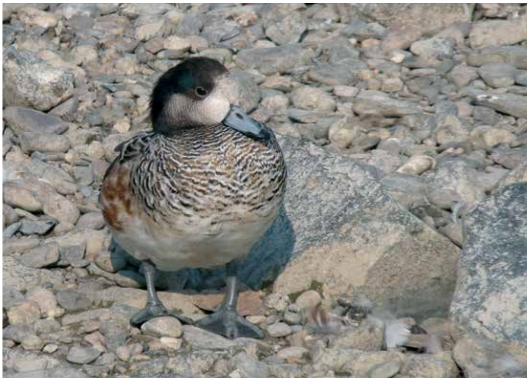
Abb. 35: Chilefeifente, Chiloe Wigeon , Mondorfer Rheinfähre SU, 19.09.2009.