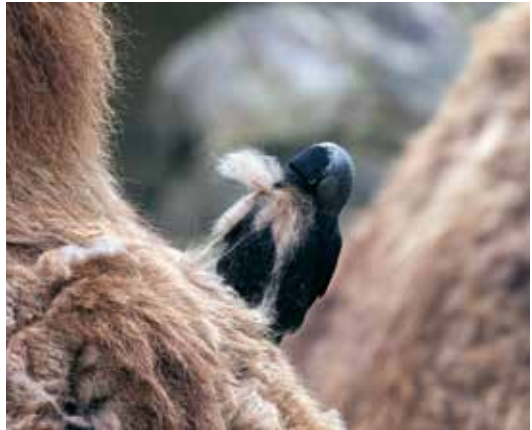
Abb. 29: Auf echtem Mohair sind die Eier weich gebettet - diesen Dohlen im Allwetterzoo in Münster dienten Kamelhaare als Nistmaterial, Apr 2009.

Western Jackdaw taking camel hair as nesting material at Münster Allwetterzoo.