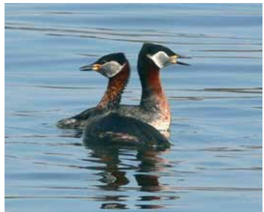
Abb. 11: Balzende Rothalstaucher sind in NRW ein seltener Anblick! Möhnesee SO, 16.04.2009.

55-56 Bp mit 90 juv im HSK (Erfassungsgrad 100%) (OAG HSK, Artbearbeitung wiw) < 12.7.-11.8. ein ad Ind auf den Klärteichen Bedburg BM ernährte sich fast ausschließlich von Wasserfrös-