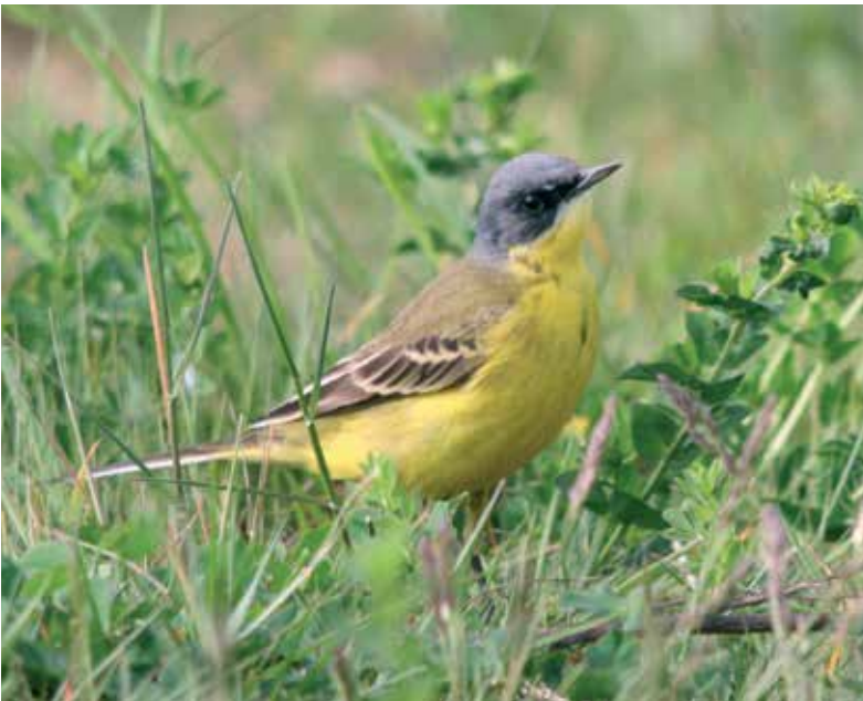
Abb. 33: Thunbergschafstelze, Grey-headed Wagtail , Windheimer Marsch ML, 15.05.2009.

2.5. 35 Ind Rieselfelder Münster MS (mbt).