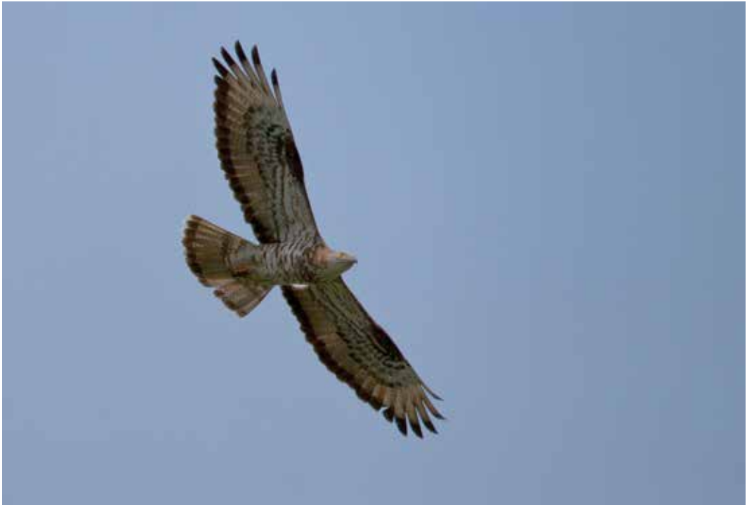
Abb. 17: Wespenbussard, European Honey Buzzard , Rieselfelder Münster, Mai 09.