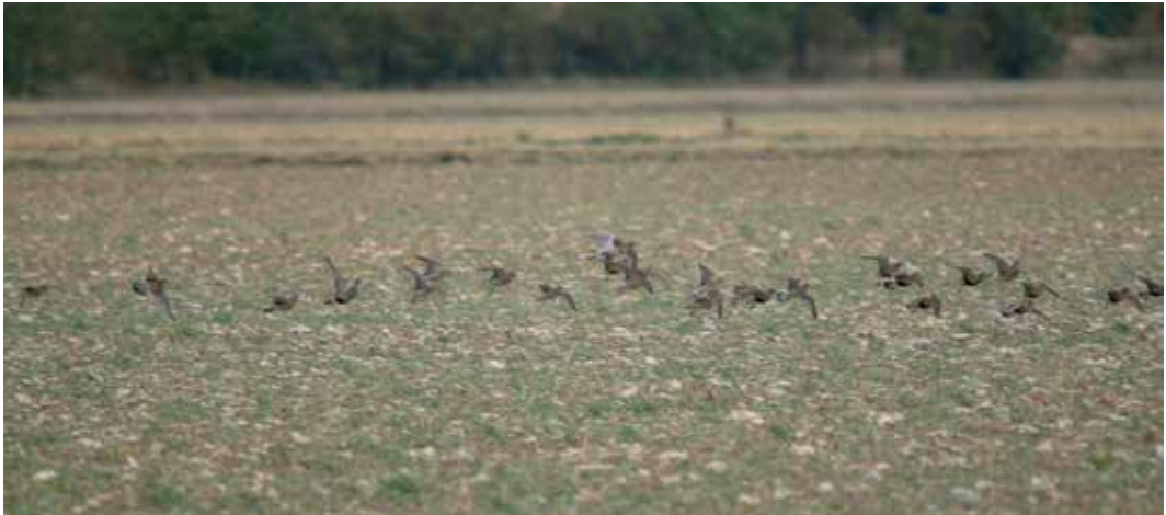
Abb. 23: 26 Mornellregenpfeifer, Eurasian Dotterel , auf einem Bild! Geseke SO, 06.09.2009.