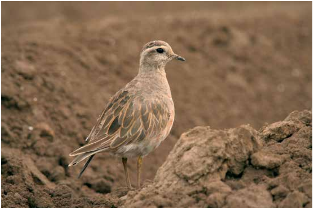
Abb. 22: Mornellregenpfeifer, Eurasian Dotterel , Felder von Hagenbroich VIE, 28.04.2009.