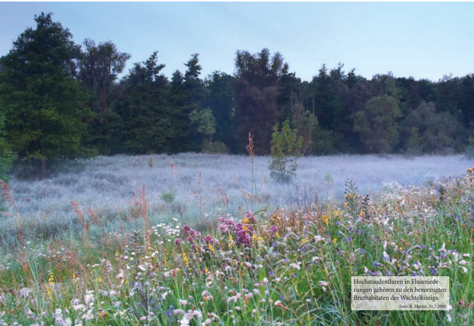
Hochstaudenfluren in Flussniederungen gehören zu den bevorzugten Bruthabitaten des Wachtelkönigs.