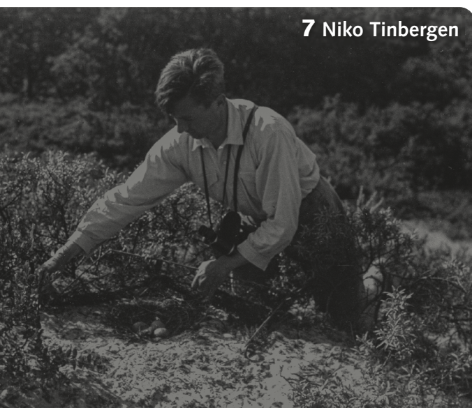
7 Niko Tinbergen