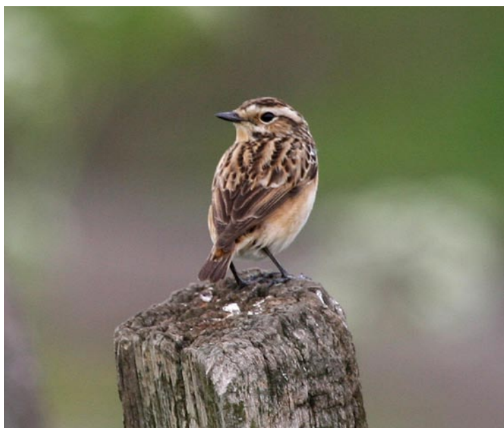
Abb. 24: Braunkehlchen Whinchat , 6.5.2006, Bergkamen, UN.

Im Kreis Borken 10-15 Reviere im Amtsvenn, Hündfelder Moor, Ammeloer Venn, Zwillbrocker