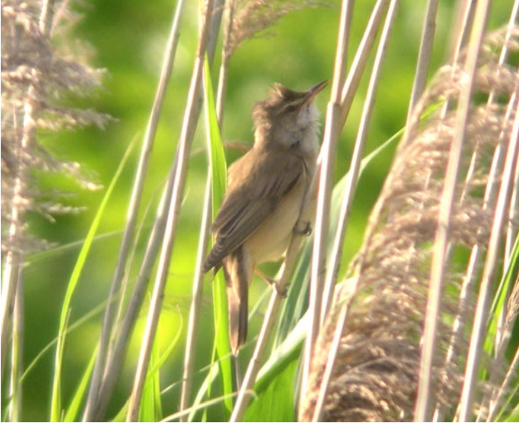
Abb. 23: Vom Drosselrohrsänger Great Reed Warbler wurden 2006 wieder einige Reviere in NRW festgestellt. 30.5.2006, Rieselfelder Münster.