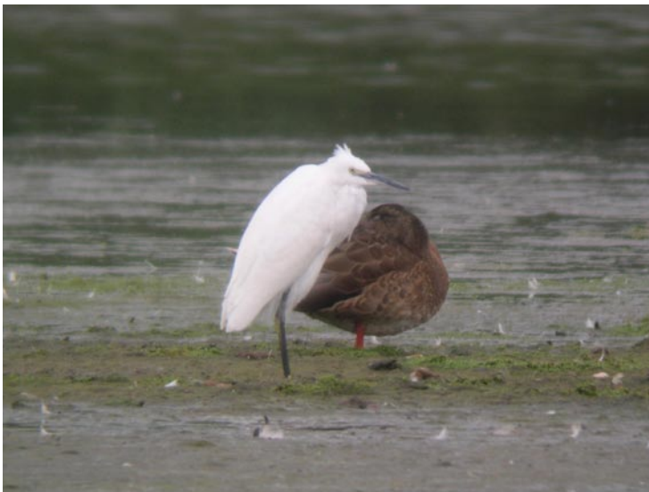
Abb. 9: Ein Seidenreiherr Little Egret vor einer Stockente, Mallard , 15.8.2006, Rieselfelder Münster.

21 Reviere (8 Brutnachweise mit mindestens 19 Jungvögeln) im HSK (stf) < Ein Bp mit 2 Jungvögeln bei Morsbach GM, dort auch ein zweites Paar,