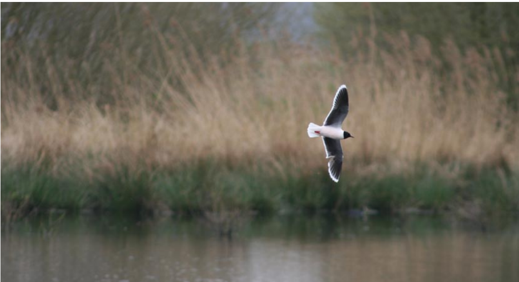
Abb. 15: Zwergmöwe Little Gull , ad. PK, 22.4.2006, Rieselfelder Münster.

4-6 Bp im Zwillbrocker Venn BOR < 6.5. ein Paar in der Lachmöwenkolonie bei Petershagen-Wietersheim – der Pächter, der Angelverein Vlotho, erlaubt später nicht das Befahren des Sees und das Beringen der jungen Möwen dort (haj) < 3.3. eine im NSG Versunken Bokelt, Rhede BOR (böw) < 25.3. 2 ad. auf einem Feld bei Erftstadt-Essem BM (kum), zudem weitere sechs Nachweise einzelner Individuen aus den Monaten April, Mai und Juni im Rhein-Erft-Kreis (kum) < 6.-9.4. balzt ein Paar