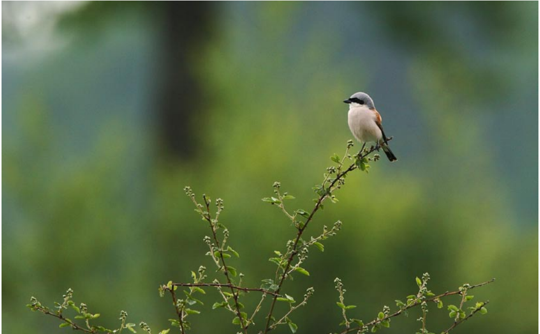
Abb. 20: Einer der am Niederrhein seltenen Neuntöter Red-backed Shrike, 29.5.2006.