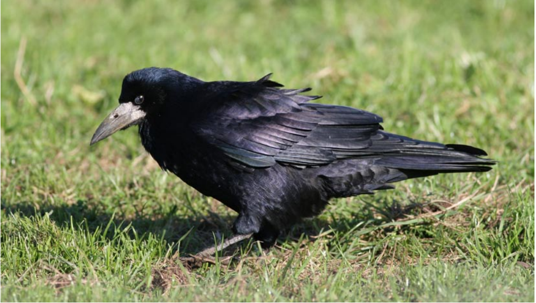
Abb. 21: Saatkrahe Rook , 20.10.2006, Viersen-Süchteln, VIE.