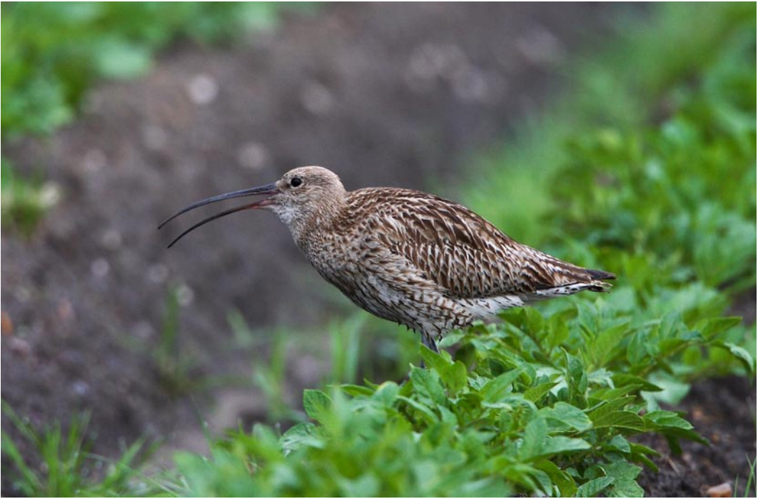
Abb. 14: Großer Brachvogel Eurasian Curlew , 5.6.2006, Niederrhein.