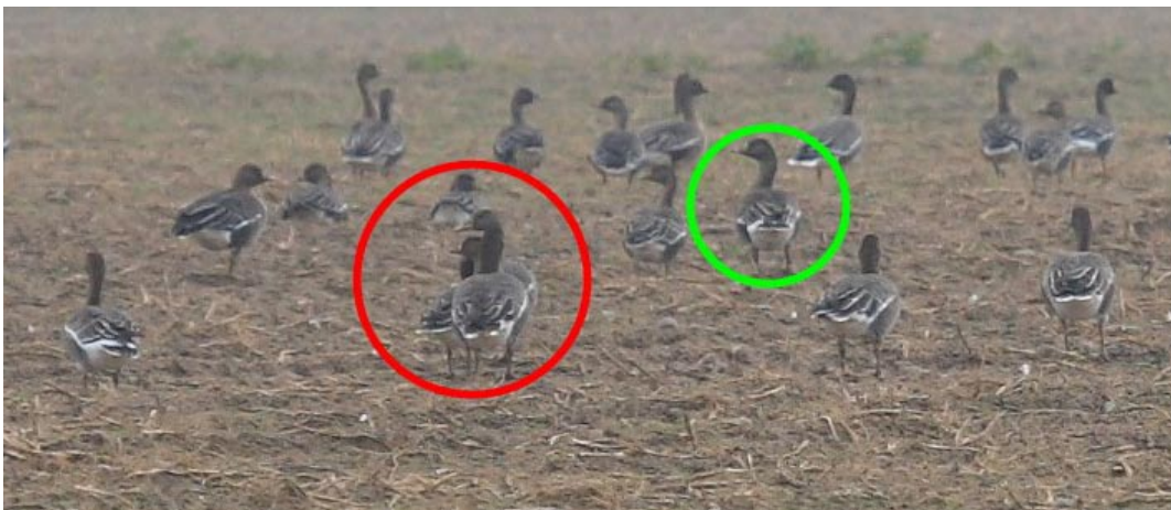
Abb. 4: Eine Wald-Saatgans (roter Kreis) inmitten von Tundra-Saatgänsen. Vergleiche Größe und das Kopfprofil mit der Tundra-Saatgans im grünen Kreis. Acker östl. Rosau bei Rees-Bienen, KLE, 17.12.2006.

Ein Paar brütete im NSG Emmericher Ward, Emmerich KLE, ein Paar im NSG Hetter, Emmerich/Rees KLE (fide dod/NABU-Naturschutzstation im Nordkreis Kleve) ◇ 8.6. Brutnachweis Klärteiche Zuckerfabrik Lage LIP: Weibchen mit 7 Jungvögeln (möe) ◇ 28.5. Brutnachweis Windheimer Marsch bei Petershagen-Windheim MI: Weibchen mit 8 Jungvögeln (möe) ◇ 2006 2 Bp VSG Rietberger Emsniederung GT, ein Bp NSG Vermolder Bruch GT, 7 Bp NSG Rietberger Fischteiche GT (BSt BI/GT) ◇ 6 Paare brüteten im NSG Walsumer Rheinaue DU (mej) ◇ 8 Paare brüteten am Bienener Altrhein Rees KLE, ein Paar am Millinger Meer/Hurler Meer KLE, ein Paar im NSG Grietherorter Altrhein, Rees KLE, im NSG Salmorth, Kleve KLE 3 Paare (NZKK).