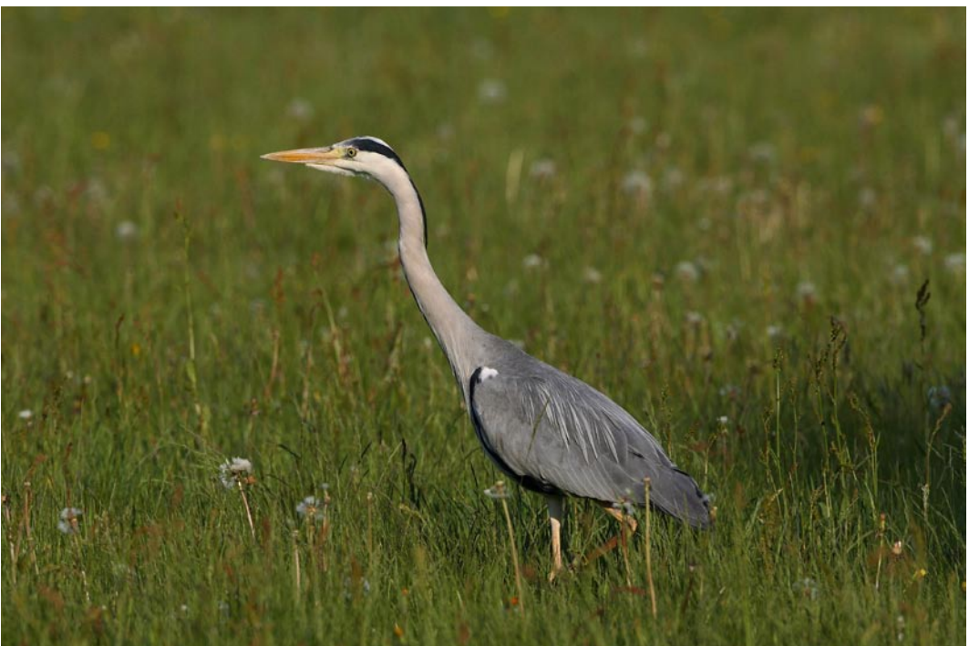
Abb. 8: Graureiher Grey Heron , 11.5.2006, Niederrhein.