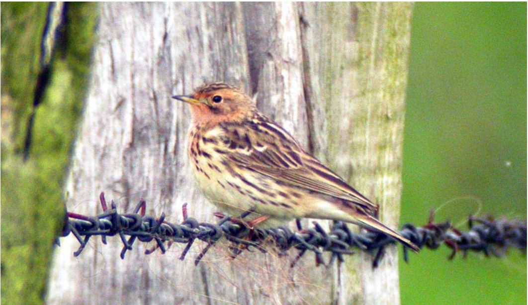
Abb. 25: Rotkehlpieper Red-throated Pipit, 30.4.2006 Rieselfelder Münster.