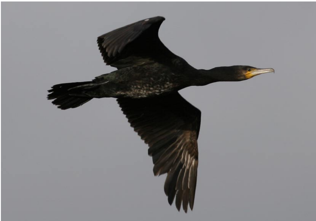
Abb. 5: Kormoran Great Cormorant , 20.10.2006, Krickenbecker Seen, Nettetal, VIE.

Starkes Vorkommen im Winter 2006/7: Maximal 3 dj. bzw. vj. auf dem Baggersee Königshütte, Kempen VIE (seg, huk, hum, hud, huh, stb u.a.). Der erste Vogel erschien dort am 17.11., der zweite folgte am 16.12., das Trio war am 29.12. komplett. 3 Ind. blieben bis zum 20.3.2007, einer konnte noch am 6.4.2007 gesehen werden. Dies stellt den