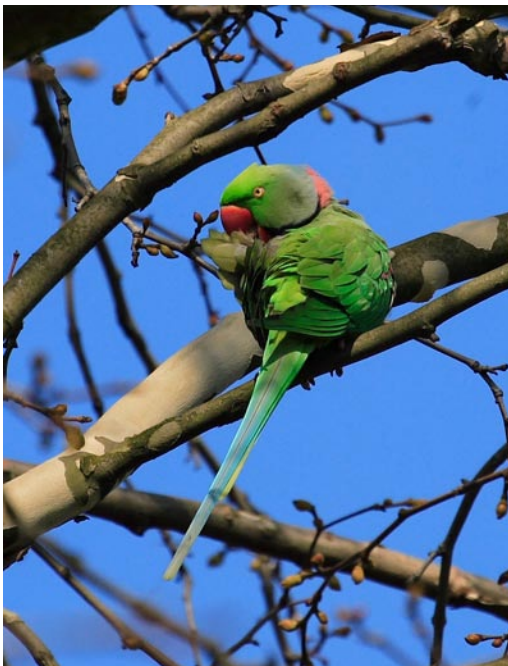
Abb. 17: Alexandersittich Alexandrine Parakeet aus der freilebenden Brutpopulation im Kölner Zoo, 25.3.2006.

30.05. eine Rieselfelder Münster MS (weh) <math>\diamond</math> 10.06. eine NSG Hallerey DO (ner).