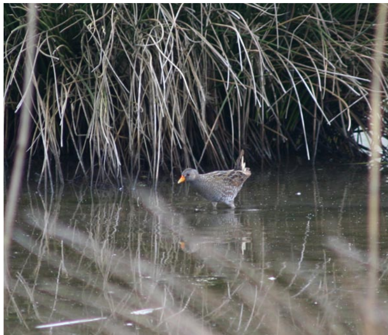
Abb. 11: Tüpfelsumpfhuhn Spotted Crane , 23.4.2006, Rieselfelder Münster.