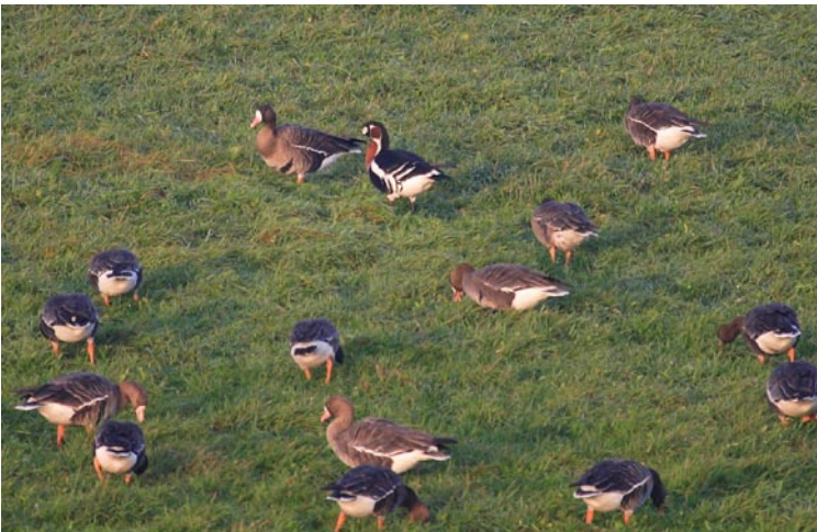
Abb. 3: Eine Rothalsgans am Rande eines Blässganstrupps. Rheinvorland unterhalb der Emmericher Rheinbrücke, KLE, 17.12.2006.

18.1. eine im NSG Walsumer Rheinaue DU (kok) < 9.2. 4 im NSG Versunken Bokelt Rhede BOR (böw) < 2.11. eine auf dem Deichvorland bei Eversael Rheinberg WES (bed) < 14.12. 2 unter Tundra-Saatgänsen südl. der Rosau, Rees KLE (srs)