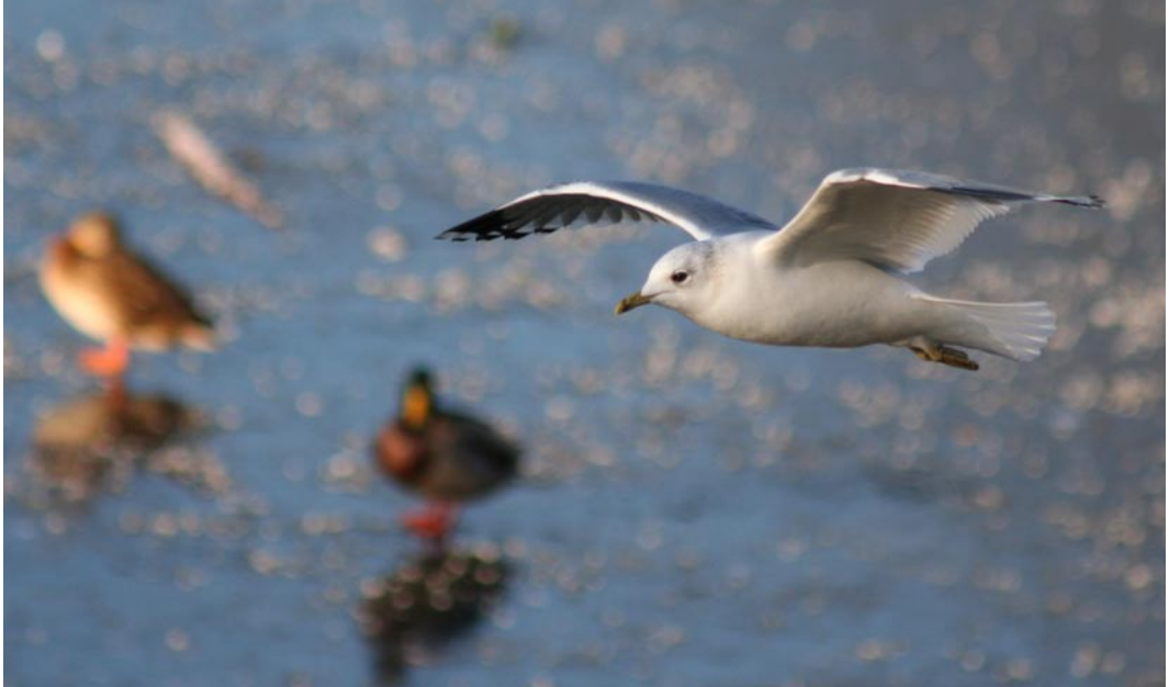
Abb. 16: Noch nie wurden in NRW so viele Sturmmöwen Common Gull gezählt wie 2006. Hier schwebt eine davon (ad. SK) über 2 Stockenten Mallard. 15.1.2006, Kemnader See BO/Witten EN.

(ad.+K3) in den Riesefeldern Münster MS, um dann wieder zu verschwinden; weitere regelmäßige Beobachtungen mit bis zu 3 Ind. im Frühjahr und Herbst (lah, krj, weh, esu, scc, frf, gal u.v.a.) < 30.4. 4 im Steinhorster Becken PB (baa), am 23.5. 1 ad. dort (boh, böa), auch 2.6. (haj) < 1.6. eine am Rheinufer bei Köln-Riehl K (böh) < 23.6. eine ad. sitzt zwischen Flusseeeschwalben in einer Sandgrube bei Petershagen-Windheim MI (möe) < 6.8. eine im Jugendkleid in der Zülpicher Börde östlich von Zülpich-Wichterich EU (kum) < 27.8 zwei und am 3.9. eine dj. in der Zülpicher Börde nordwestlich von Weilerswist-Lommersum EU (kum) < 6.9. eine dj. am Kemnader See BO/Witten EN (weh) < 7.9. 2 dj. am Kemnader See BO/Witten EN (noj) < 25.12. eine im ersten Kalenderjahr Kemnader Stausee BO/Witten EN (noj).