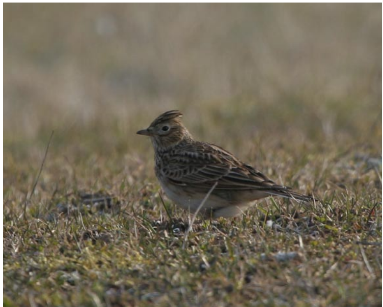
Abb. 22: Feldlerche Skyllark, 15.3.2006, Bislicher Insel

Zur Brutzeit insgesamt 46 Reviere im NSG Rietberger Fischteiche GT (BSt BI/GT) <> 140-160 Reviere in der Lippeaue Hamm (= 1.200 ha) – eine der größten Populationen in NRW (pow).