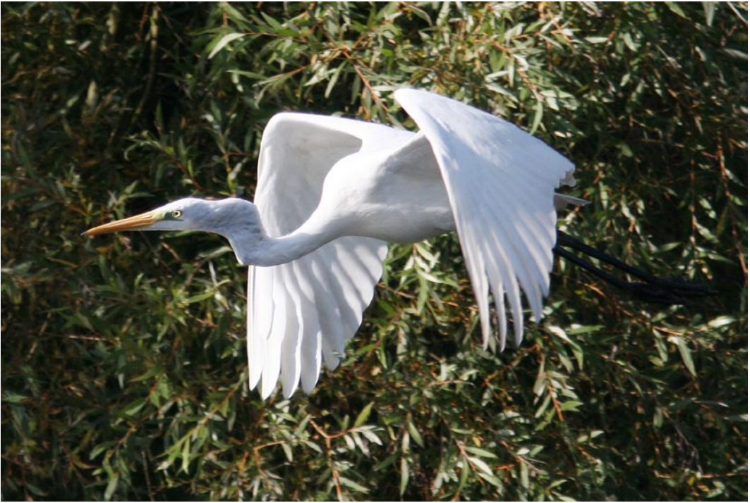
Abb. 7: Silberreiher Great White Egret , 25.11.2006, Bislicher Insel, WES.