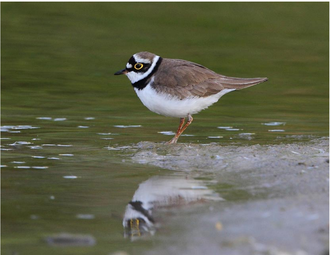
Abb. 12: Flussregenpfeifer Little Ringed Plover , ad. PK, 6.5.2006, Niederrhein.

Im HSK ausgestorben, im Jahr 2006 konnte kein Brutnachweis erbracht werden (OAG HSK) < 14.03. 2.140 rasten in der Lippeaue Hamm-Ost, z.T. im NSG Schmehauser Mersch HAM (pow) < 20.3. mindestens 4.000 Individuen ziehen zwischen 13:30 und 15:00 Uhr über die Rieselfelder Münster MS (hav) < 25.03. 3.000 rasten zwischen Birkelbach und Hemschlar SI, wegen extremer Schlechtwetterlage (frm, pos, psv) < 23.09. ein Trupp von