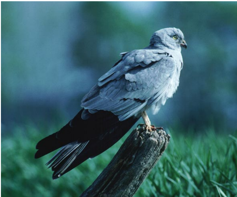
Abb. 10: Wiesenweihe Montagu's Harrier , Männchen aus dem Weihenschutzprogramm auf dem Haarstrang.

5.5. ein ad.s Männchen Rieselfelder Münster MS (lah), dort auch ein ad.s Männchen am 8.6. (krj, frf) und möglicherweise derselbe Vogel am 10.6. (scj) sowie ein weiteres Individuum am 12.7. (lah) <math>\diamond</math> 8.5. ein Männchen über dem De-Wittsee Nettetal VIE (huk), 7. Nachweis für den Kreis Viersen.