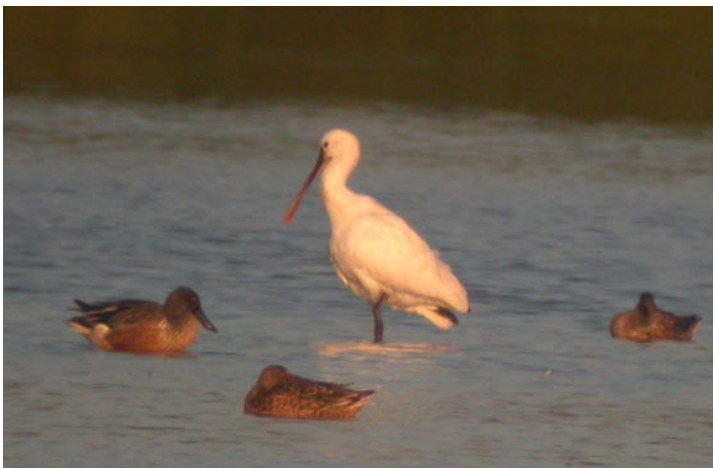
Abb. 6: Das Anwachsen der Brutbestände führt dazu, dass Löffler nun auch häufiger in NRW gesichtet werden. Hier ein Vogel im K2 am 10.9.2006 in den Rieselfeldern Münster neben Löffelenten.

Zahlreiche Beobachtungen; Ansammlungen von mehr als 5 Individuen wurden wie folgt festgestellt: 10.1. und 1.3. 14 an den Krickenbecker Seen, Nettetäl VIE (pls, huk) <math>\diamond</math> 29.1. 8 bei Wissel, Kalkar KLE (chk) <math>\diamond</math> 14.2. 7 bei Blomberg LIP, dort am 15.2. 6 Individuen (OAG LIP) <math>\diamond</math> 7.10. 8 bei Petershagen-Windheim MI, dort am 19.11. 11 Individuen